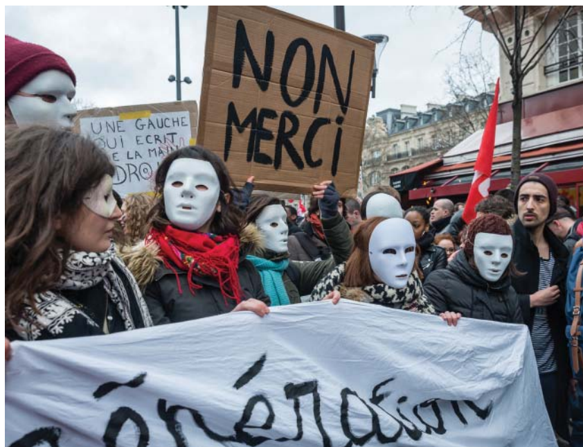
Romani / Photoque du mouvement social