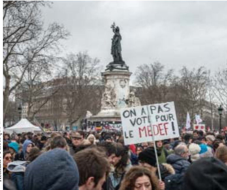
Romani / Photoque du mouvement social

Le projet de loi El Khomri doit être abandonné, le rapport de force avec les entreprises doit garantir la protection des salariés.